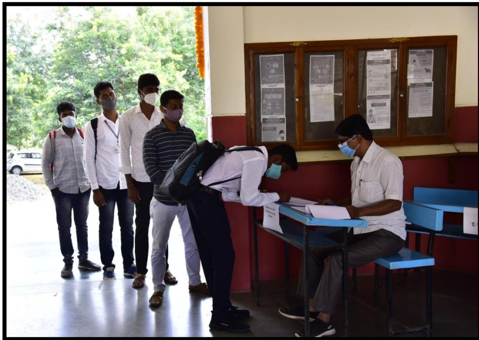
✚ Spot Registration B. Sc. Graduates