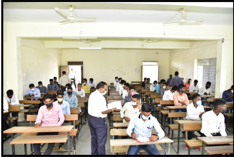
✚ Written Examination of B. Sc. graduates.