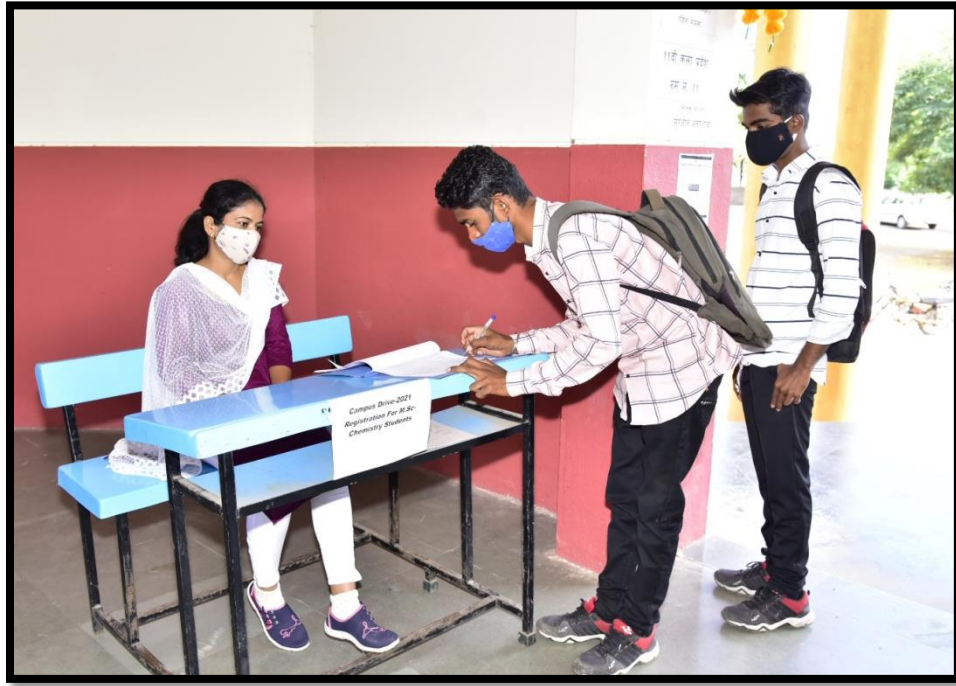
✚ Spot Registration M. Sc.